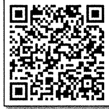
รายละเอียดระยะเวลา