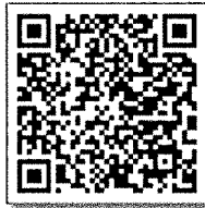
บัญชีรายชื่อ_รุ่นที่ ๘

ปทุมธานี, พระนครศรีอยุธยา, พัทลุง, พิษณุโลก, เพชรบุรี, เพชรบูรณ์, ลพบุรี, สตูล