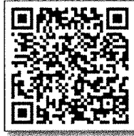
บัญชีรายชื่อ_รุ่นที่ ๒

กระบี่, กาฬสินธุ์, กำแพงเพชร, ชัยนาท, นครพนม, น่าน, บึงกาฬ, บุรีรัมย์, พังงา, ภูเก็ต, มุกดาหาร, สกลนคร